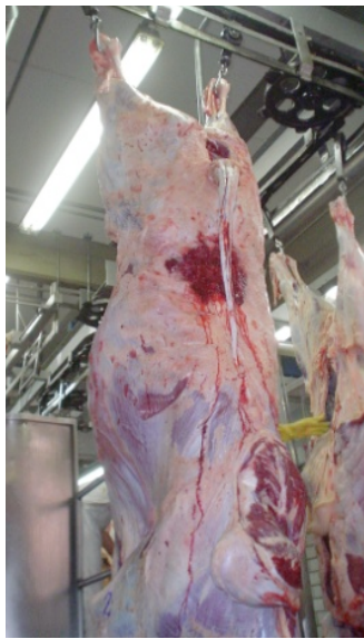
Figura 1- Manejo convencional sin adopción de buenas prácticas (antes de la capacitación).

Felizmente, la visión de que los animales que van a ser sacrificados en los mataderos frigoríficos pueden ser manejados de cualquier forma está cambiando. Las investigaciones muestran cuanto los productores e industrias frigoríficas pierden por no adoptar mejores prácticas de manejo.